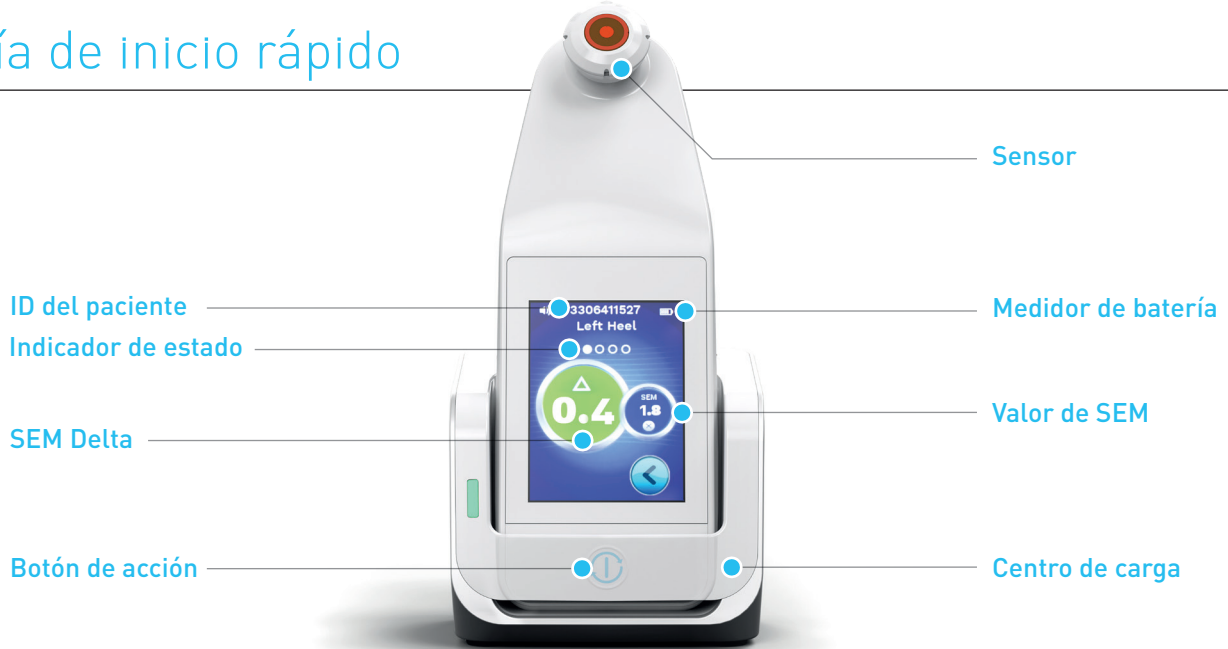
Figura 1: Pantalla del escáner SEM Provizio™