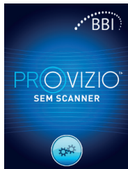
Figura 2: Pantalla de bienvenida del dispositivo

Encienda el escáner SEM Provizio™ retirándolo del centro de carga o pulsando el botón de acción hasta que la pantalla se ilumine y aparezca la pantalla de bienvenida (Figura 2). El cabezal del sensor (Figura 1) no se debe tocar durante este tiempo.