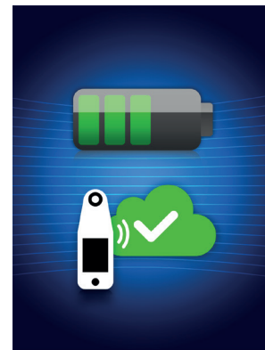
Figura 9: Pantalla de carga

Para cargar, coloque el dispositivo en el Centro de carga (Figura 8). La luz del Centro de carga comenzará a parpadear en verde. Mientras el dispositivo está en el Centro de carga, la pantalla táctil está desactivada, la pantalla muestra el estado de la carga de datos y el nivel de carga de la batería (Figura 9). El dispositivo está completamente cargado cuando se iluminan cinco barras verdes.