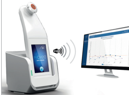
Figura 8 - Centro de carga Provizio™

Para cargar las lecturas tomadas, coloque el escáner SEM Provizio™ en el Centro de carga (Figura 8), el dispositivo inicia las comunicaciones inalámbricas y se conecta al servidor de la puerta de enlace, todas las sesiones de datos almacenadas se cargan en los registros del paciente y se eliminan del dispositivo.