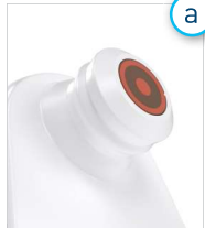
Figure 3 – Scanner à tête fixe intégré

Allumez le SEM Scanner Provizio MD en le retirant de la station de charge ou en appuyant sur la touche d'action jusqu'à ce que l'écran s'allume et que l'écran de démarrage s'affiche (Figure 2). La tête du capteur (Figure 1) doit rester intacte pendant ce temps.