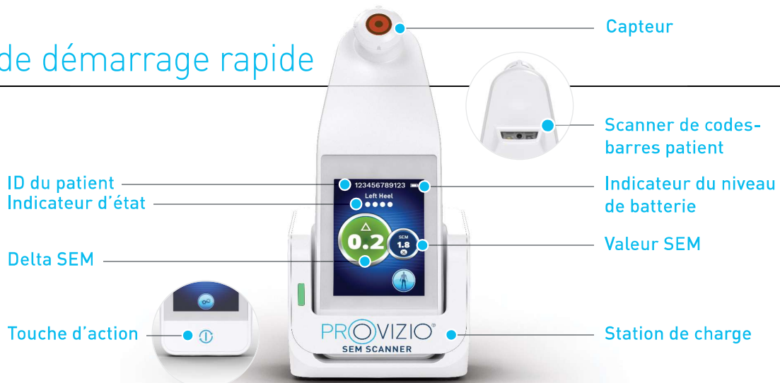
Figure 1 – SEM Scanner Provizio MD et station de charge