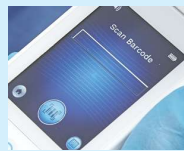
Figure 7 – Écran Barcode Scanning (Lecture de codes-barres)

Appuyez sur le bouton Barcode (Code-barres) pour exécuter le chargement complet des données. Utilisez ce mode si le patient possède un bracelet à code-barres et si le tableau de bord du portail du SEM Scanner Provizio est installé sur votre réseau Wi-Fi.