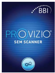
Figure 2 – Écran de démarrage

Allumez le SEM Scanner Provizio MD en le retirant de la station de charge ou en appuyant sur la touche d'action jusqu'à ce que l'écran s'allume et que l'écran de démarrage s'affiche (Figure 2). La tête du capteur (Figure 1) doit rester intacte pendant ce temps.