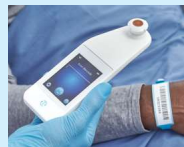
Afbeelding 8 - Een streepjescode van een patiënt scannen

Druk op de streepjescodeknop op het scherm om streepjescodes te scannen (afbeelding 7)