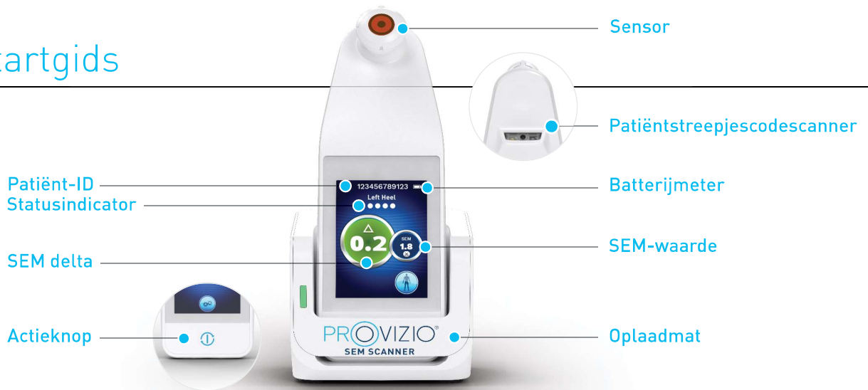
Afbeelding 1 - Provizio® SEM-scanner en oplaadhub