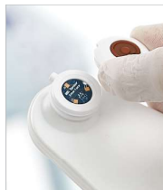
Figuur 11 - De Provizio SEM-scannersensor verwijderen

Als u de sensorscanner voor eenmalig gebruik gebruikt, verwijdert u de sensor door deze voorzichtig van de sensorconnector te trekken.