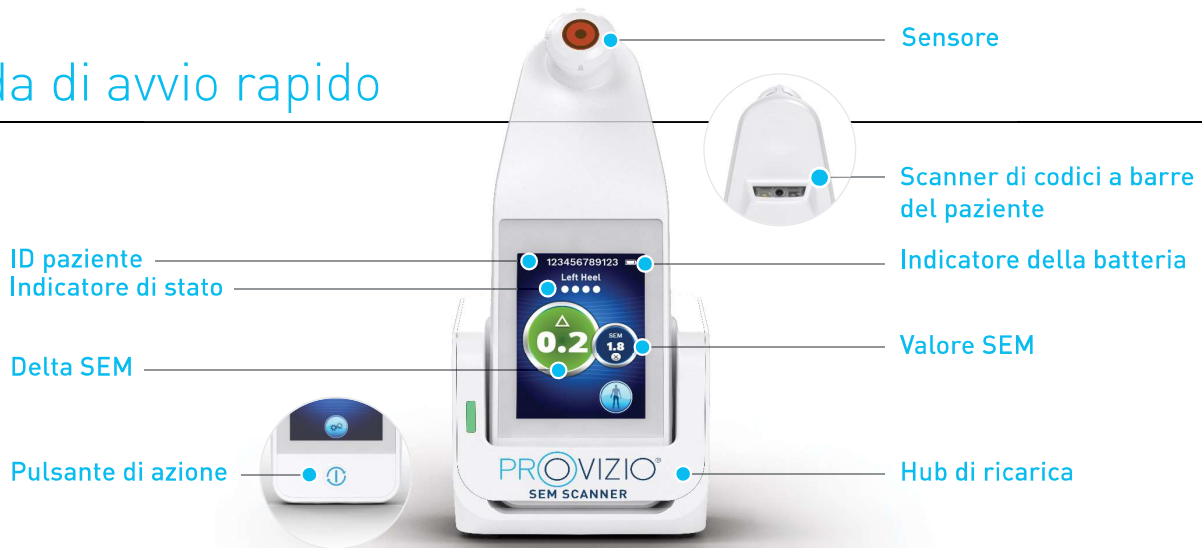
Figura 1 - Scanner SEM Provizio® e hub di ricarica