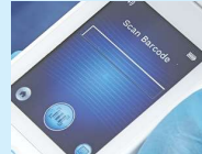
Figura 7 - Schermata di scansione del codice a barre