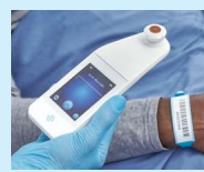
Figura 8 - Scansione di un codice a barre del paziente

Premendo il pulsante del codice a barre verrà implementato il caricamento completo dei dati. Utilizzare questa modalità se il paziente dispone di un braccialetto da polso con codice a barre ed è presente il gateway per scanner SEM Provizio Il dashboard viene installato sulla rete WiFi