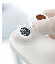
Figura 4 - Schermata di installazione del sensore