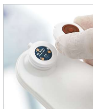
Figura 11 - Rimozione del sensore dello scanner SEM Provizio

Se si utilizza lo scanner con sensore monouso, rimuovere il sensore estraendolo delicatamente dal connettore del sensore.