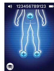
Figura 9 - Schermata di selezione della posizione del corpo

Premendo il pulsante Formazione nell'angolo inferiore sinistro verrà implementata una modalità di test solo per la formazione