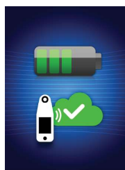
Figura 13: Pantalla de carga

Para cargarlo, coloque el escáner en el centro de carga (Figura 12). La luz del centro de carga empezará a parpadear en verde. Mientras el dispositivo está en el centro de carga, la pantalla táctil está desactivada, la pantalla muestra el estado de la carga de datos y el nivel de carga de la batería (Figura 13).