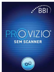
Figura 2: Pantalla de bienvenida

Encienda Provizio® SEM Scanner retirándolo del centro de carga o pulsando el botón de acción hasta que la pantalla se ilumine y aparezca la pantalla de bienvenida (Figura 2). El cabezal del sensor (Figura 1) no se debe tocar durante este tiempo.