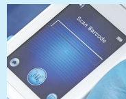
Figura 7: Pantalla de escaneo de código de barras

Al pulsar el botón de código de barras, se ejecutará la carga de datos completa. Utilice este modo si el paciente tiene una pulsera con código de barras y el tablero de Gateway de Provizio SEM Scanner está instalado en su red WiFi.