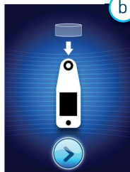
Figura 4: Pantalla de instalación del sensor

Si utiliza Provizio SEM Scanner con cabezal fijo integrado, después de aproximadamente 4 segundos, aparecerá la pantalla de modo de funcionamiento (Figura 6).