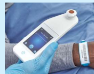
Figura 8: Escanear el código de barras de un paciente

Presione el botón de código de barras en la pantalla de escaneo de código de barras (Figura 7).