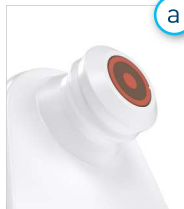
Figura 3: Escáner con cabezal fijo integrado

Encienda Provizio® SEM Scanner retirándolo del centro de carga o pulsando el botón de acción hasta que la pantalla se ilumine y aparezca la pantalla de bienvenida (Figura 2). El cabezal del sensor (Figura 1) no se debe tocar durante este tiempo.