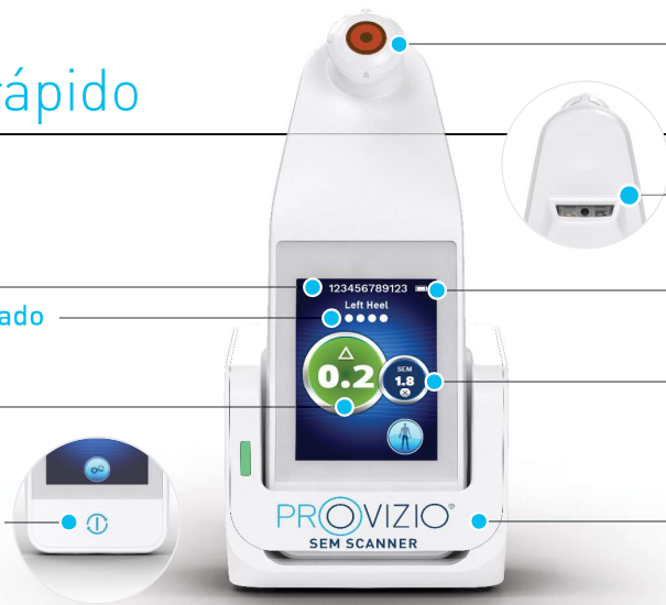
Figura 1: Provizio® SEM Scanner y centro de carga