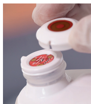
Figure 4 - Installation du capteur de Provizio MC SEM Scanner

Retirez le capteur à usage unique Provizio MC SEM Scanner de son emballage et placez-le sur la tête de capteur (Figure 4). Vous entendrez un « clic » lorsque le capteur sera placé correctement. Note : chaque session de balayage d'un patient nécessite un nouveau capteur.