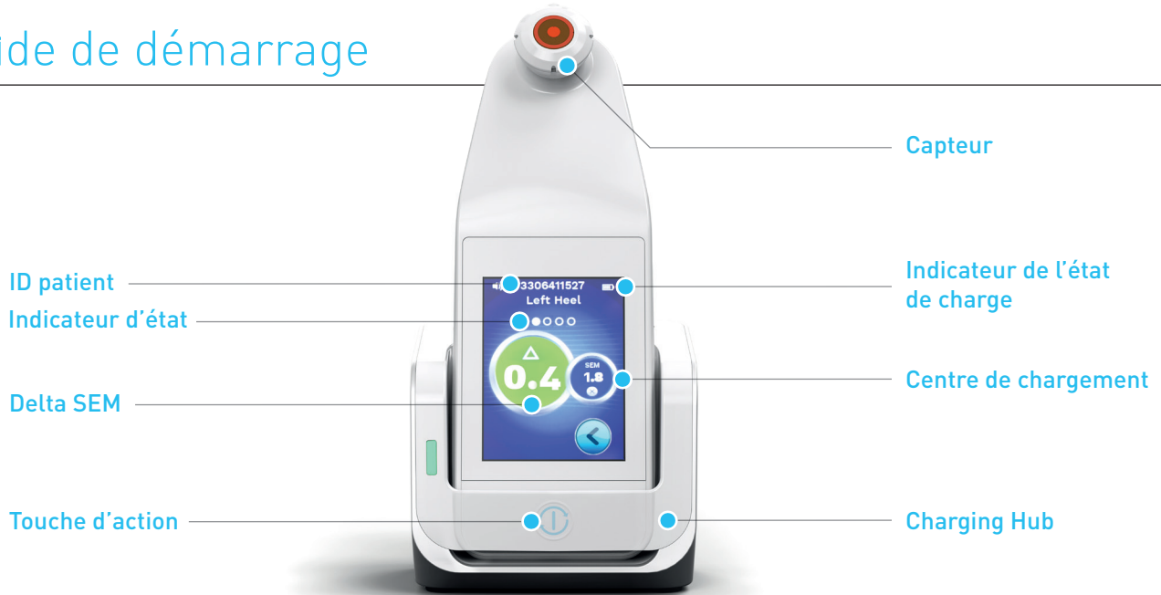
Figure 1 - Affichage du Provizio MC SEM Scanner