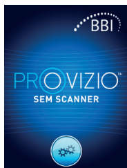
Figure 2 - Écran Device Splash (Démarrage de l'appareil)

Allumez le Provizio MC SEM Scanner en le retirant du centre de chargement ou en appuyant sur la touche d'action jusqu'à ce que l'écran s'allume et que l'écran de démarrage s'affiche (Figure 2). La tête du capteur (Figure 1) doit rester intacte pendant ce temps.